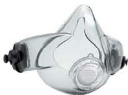
Félálarc (tartalmazza a fejpántot)

CST1034 - S - Kicsi CST1035 - M - Közepes CST1036 - L - Nagy