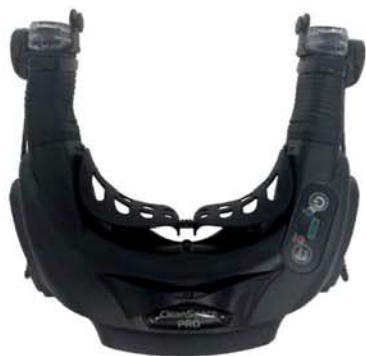
CleanSpace PRO CST1001

Tápegység* tartalmazza a nyaktámaszt, töltőt és a hordtáskát *nem tartalmazza a félálarcot és a szűrőt